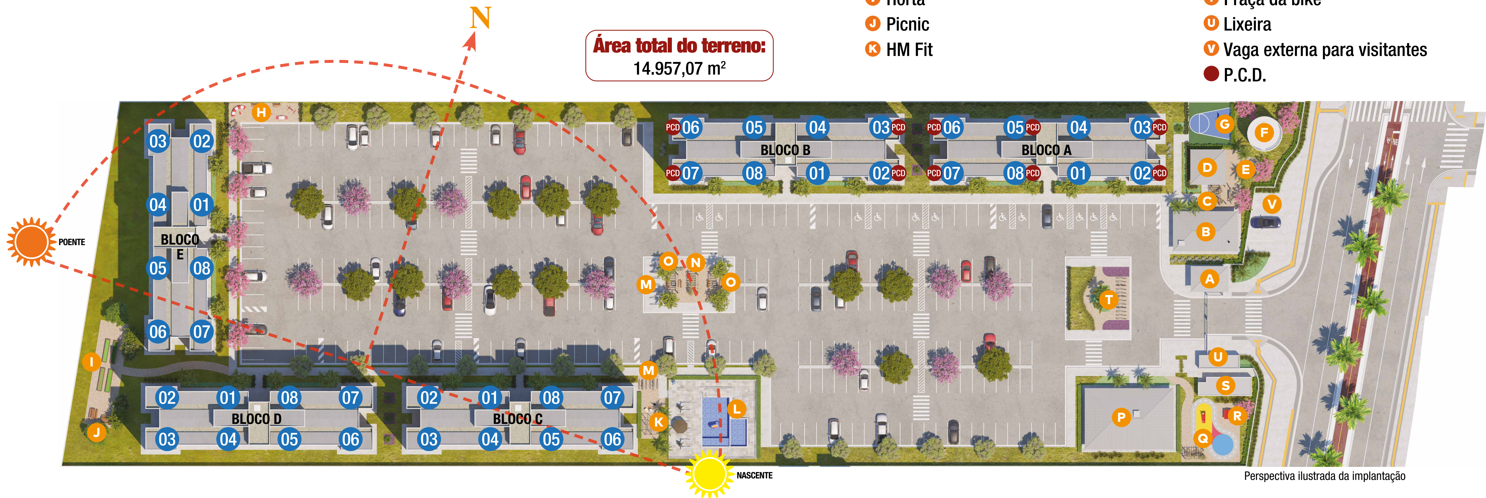
Perspectiva ilustrada da implantação